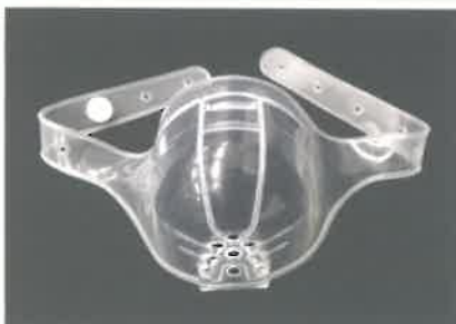
シャワープロテクター

～日々の生活を快適にするケア用品（別売り）～ *）商品の仕様は都合により変更する場合がございます。