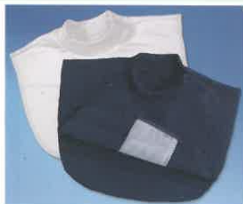
Tシャツタイプエプロン